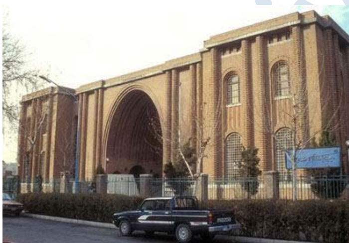
Archaeological Museum of Iran, Tehran / André Godard, ۱۹۳۶-۱۹۳۹

در این دوره، آثار مهم معماری غالباً به سفارش حاکمیت (پهلوی اول) و به دست معماران خارجی ساخته می شد، بناهایی با معماری حجیم و سنگین که در آنها سعی شده بود معماری گذشته ایران، به ویژه معماری دوران هخامنشی و ساسانی، مورد توجه قرار گیرد، توجهی صرفاً محدود به تکرار سطحی و ظاهری عناصر و شکل های بناهای عظیم و باشکوه معماری گذشته ایران. البته در این دوره کارهای دیگری رهن ساخته شدند که در آنها عناصری از معماری دوره اسلامی ایران با عناصری از معماری اروپایی در هم آمیخته شده بود. عمده آثار این دوره، بجز چند اثر معدود