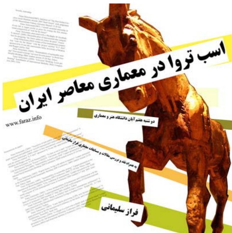
اسب تروا در معماری معاصر ایران