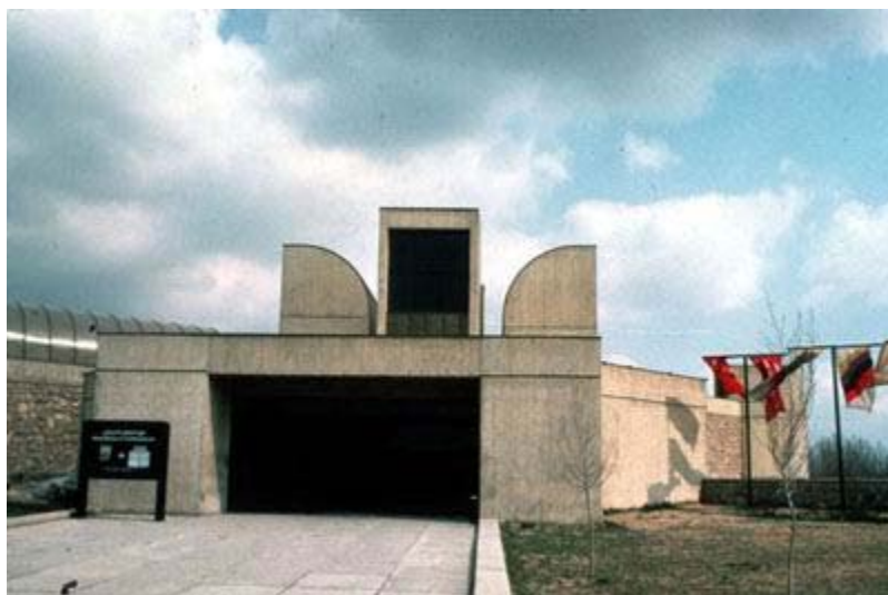
Museum of Contemporary Art, Tehran / Kamran Diba, ۱۹۷۶

دوره سوم معماری معاصر ایران همزمان با سال‌های آخر معماری مدرن است، دوره‌ای که معماری مدرن با چالش‌های جدی روبه‌روست و به تدریج یک جریان تاریخی در بطن آن شکل می‌گیرد. معماران ایرانی این دوره، همچون نادر اردلان، کامران دبا و حسین امانت، در پی پدید آوردن اثری بودند که پیوندی عمیق‌تر با معماری گذشته ایران برقرار سازند. آثار این معماران که از نمونه‌های خوب آنها می‌توان به مرکز آموزش مدیریت، کار نادر اردلان و موزه هنرهای معاصر، اثر کامران دبا اشاره کرد، در ایجاد رابطه با معماری گذشته، نسبت به آثار دوره‌های قبلی، در سطحی بالاتر قرار می‌گیرند.