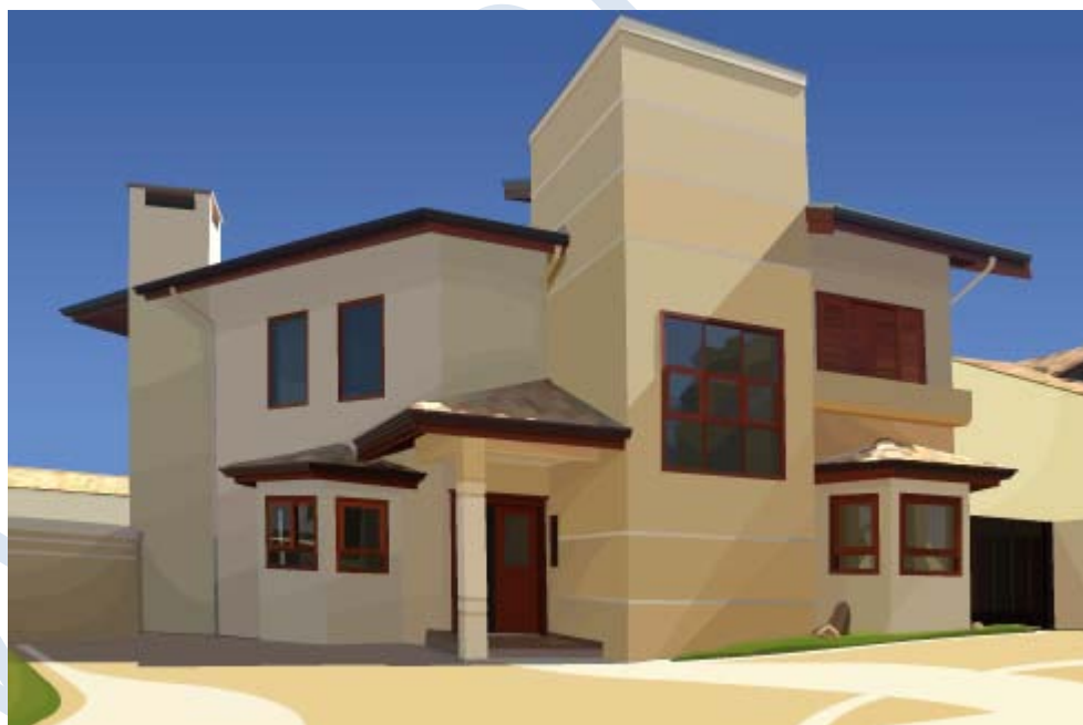
مدرنیته و معماری معاصر ایران