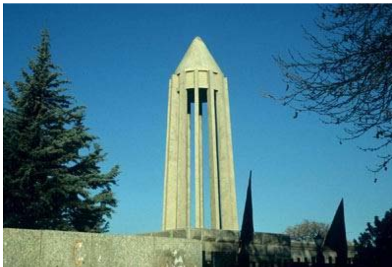
Ibn Sina Mausoleum, Hamadan / Houshang Seyhoun, ۱۹۵۲

در این دوره که از آغاز حکومت پهلوی دوم شروع می‌شود، کارهای مهم معماری عمدتاً به دست چند معمار ایرانی، مانند محسن فروغ ی، هوشنگ س مجنون و عبدالعز ی فرمانفرمایان ساخته می‌شد. بناهای این دوره بر اساس اصول و مبانی معماری مدرن شکل م ی‌گرفتند، اما کماکان توجه به معماری گذشته، در قالب استفاده از گوها و هندسه معماری ایران، در آنها به چشم می‌خورد. اگرچه این توجه از کیفیتی معمارانه‌تر نسبت به دوره‌های قبل برخوردار بود، لیکن به زعم می‌میران، در این دوره رهن کار مهمی در به‌کارگیری اصول و مبانی معماری ایران و تکامل آن به انجام نرسید. از برجسته‌ترین کارهای این دوره، می‌توان به آرامگاه بوعلی سینا در همدان، کار هوشنگ س مجنون اشاره کرد.